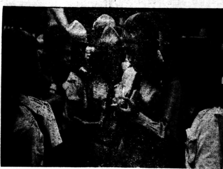
Baru2 ini Sri Sultan Jogja telah mengadakan perdjalanannya pe nindjauan pada beberapa tempat di Djawa Tengah untuk pelak...